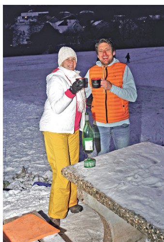
Bei einer Tasse mit wärmendem Punsch lässt sich die Kälte des Winters ertragen.