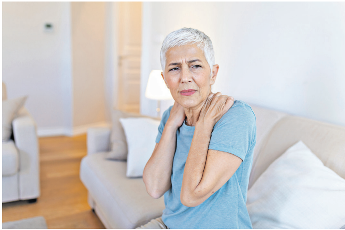
In Deutschland sind etwa sechs Millionen Menschen von Osteoporose betroffen.

Für die einen weiße Pracht, für andere gefährliche Stolperfallen: Verschneite Straßen und Tiefsttemperaturen sorgen vielerorts für Glätte. Damit steigt auch das Risiko für sturzbedingte Knochenbrüche. Besonders Menschen mit Osteoporose sind gefährdet. Ihre durch die Erkrankung porösen Knochen brechen schneller. Nach Angaben der Internationalen Osteoporosestiftung (IOF) kommt es hierzulande zu mehr als 831.000 dieser Fragilitätsfrakturen. Um eine Osteoporose zuverlässig zu erkennen und zu behandeln, empfehlen Fachleute auch Labortests.