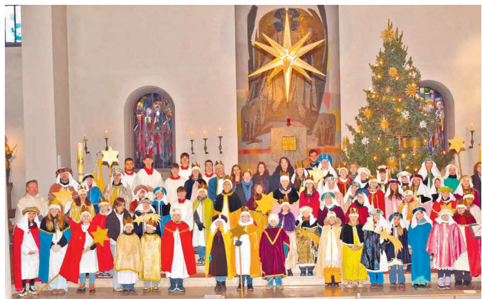
Die große Schar der prächtig gekleideten Sulzbacher Sternsinger nach dem Aussendungsgottesdienst mit Pfarrer Kycia.

Lesen Sie den vollständigen Beitrag auf www.meine-news.de/224044