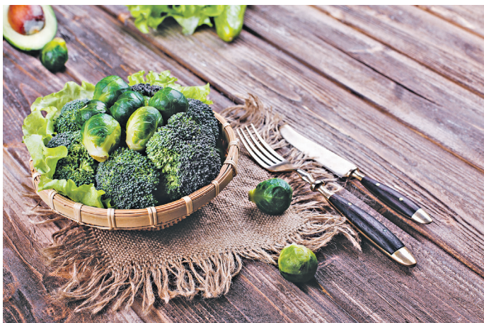
Kohlgemüse ist reich an Vitaminen, arm an Kalorien und zudem eine gute Quelle für Ballaststoffe, die der Darm braucht, um gesund zu bleiben.

Beim Gedanken an Grünkohl, Wirsing, Rosenkohl, Spitzkohl und andere Sorten haben noch vor wenigen Jahren viele Menschen die Nase gerümpft: zeitintensiv in der Zubereitung und auch optisch kein Hingucker. Dank neuer, kreativer Rezepte hat sich das aber komplett gewandelt. Zum Glück! Denn Kohlgemüse ist reich an Vitaminen und arm an Kalorien. Alle Kohlsorten sind zudem eine gute Quelle für Ballaststoffe, die der Darm braucht, um gesund zu bleiben. Ein gesunder Darm wiederum ist entscheidend für ein starkes Immunsystem.