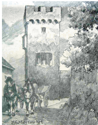
Der Hexenturm auf einer Zeichnung von 1927.

Lesen Sie den vollständigen Beitrag auf www.meine-news.de/224032