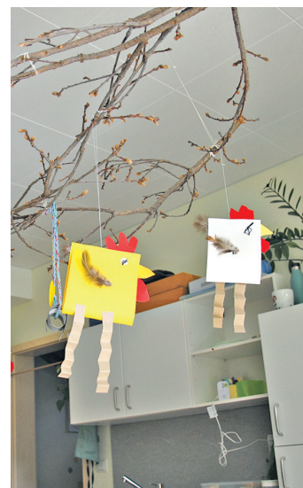
Die Krippenkinder der Kita „Kleine Strolche“ in Wörth haben diese süßen Küken gebastelt.

Die Vorschulkinder der Kleinen Strolche kennen die Ostergeschichte. „Wir feiern Ostern wegen Jesus“, schildern sie. „Er ist gestorben und wieder auferstanden. An Ostern kommt auch der Osterhase. Er bringt Schokoladeneier, einen Schokohasen und Geschenke mit. Vielleicht ein Kuschtier. Wir dürfen dann Ostereier suchen. An Ostern scheint die Sonne und viele Blumen blühen – Krokusse, Schneeglöckchen, Osterglocken, Tulpen und Gänseblümchen. Wir haben auch gebastelt. Aus einer Milchpackung haben wir Osterkörbchen gebastelt.“ akf