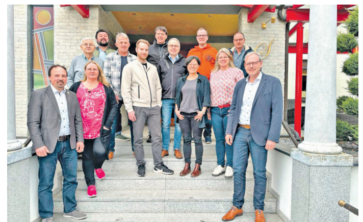
Klausurtagung der Freien Wähler im Landkreis Miltenberg.

Lesen Sie den Beitrag online auf www.meine-news.de/170668