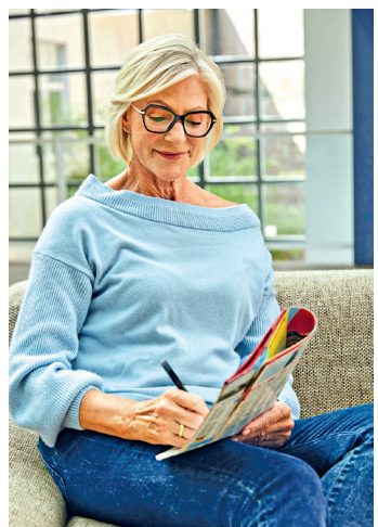
Wer beim Lesen oder für Naharbeiten nicht ständig die Fernbrille mit der Lesebrille tauschen möchte, sollte sich beim Augenoptiker zur Gleitsichtbrille beraten lassen.

(akz-o) Ab Mitte 40 setzt die sogenannte Alterssichtigkeit (Presbyopie) ein: Je ausgeprägter sie ist, desto weiter müssen Zeitung, Bücher oder Bildschirme für eine scharfe Sicht vom Auge weggehalten werden. Wer bisher keine Brille benötigte, kann auf eine Lesebrille zurückgreifen. Wenn man vorher bereits fehsichtig war, ist die Gleitsichtbrille das Mittel der Wahl. Denn diese erlaubt durch ihre Gläser stufenloses scharfes Sehen in allen Entfernungen: Oben im Glas liegt der Bereich für die Fernsicht, unten der Nahsichtbereich zum Lesen oder für alles, was in geringer Sehentfernung stattfindet, und in der Mitte ein Übergangsbereich, um zum Beispiel den Schreibtisch zu überblicken. Diese Übergänge erfolgen stufenlos und unmerklich, wenn die Gleitsichtbrille fachmännisch und individuell vom Augenoptiker angepasst wurde.