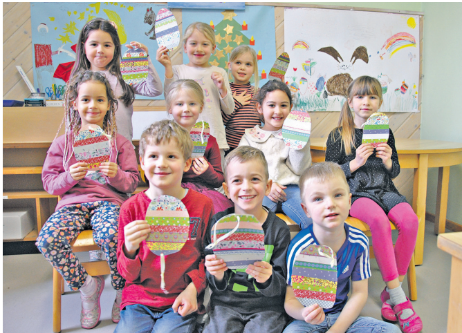
Mit einem Blatt Papier und Streifen von Geschenkpapier haben die Kinder der Kita „Weinbergstraße“ in Erlenbach-Mechenhard Oster Eier gebastelt.

Leidensgeschichte Jesu oder Osterhase? Neben der Ostergeschichte und der dahinter stehenden österlichen Botschaft ist das Osterfest bei uns auch immer mit dem Osterhasen, Ostereiern und der Suche nach Osternestern verbunden.