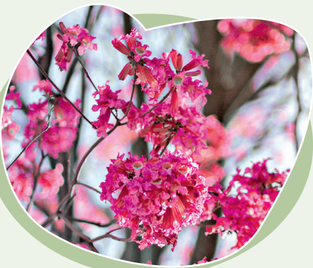
Heimische Gehölze wie der Trompetenbaum sind widerstandsfähig und können auch in veränderten Klimabedingungen gedeihen.

Elemente wie Hügel, Mulden und erhöhte Beete können dazu beitragen, Regenwasser gezielt zu leiten und die Entwässerung zu unterstützen. Verwenden Sie wasserdurchlässige Materialien wie Kies oder Pflastersteine, um Oberflächenversiegelung zu minimieren.