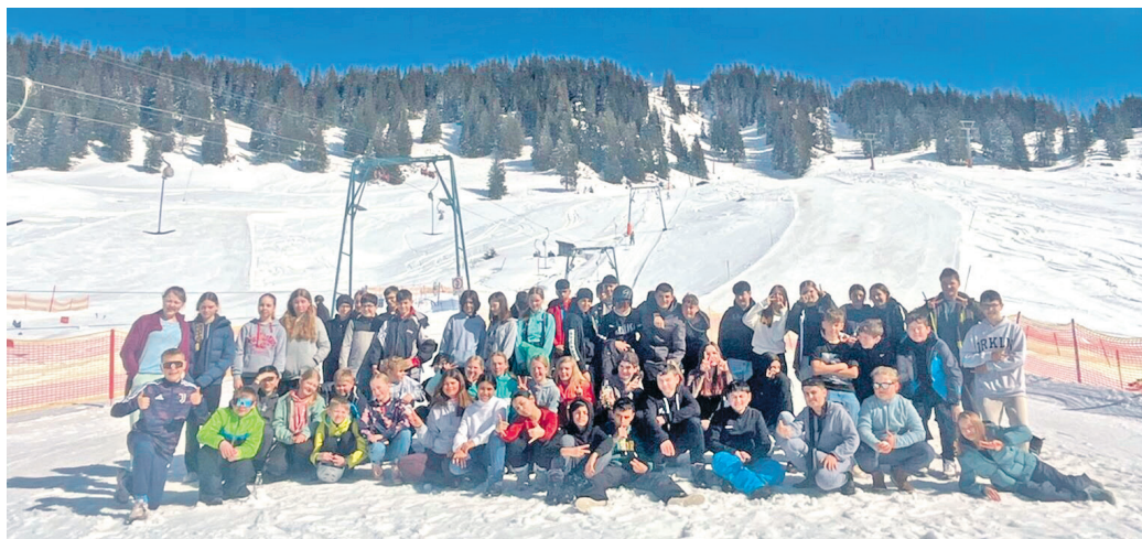
Gruppenbild auf der Piste im Allgäu!

Lesen Sie den vollständigen Beitrag auf www.meine-news.de/170306