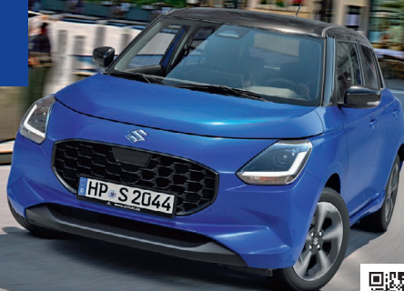
Abbildung zeigt aufpreispflichtige Sonderausstattung. Mehr Informationen zu Ausstattungslinie und Sonderausstattungen finden Sie hier: