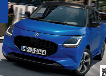
Abbildung zeigt aufpreispflichtige Sonderausstattung. Mehr Informationen zu Ausstattungslinie und Sonderausstattungen finden Sie hier: