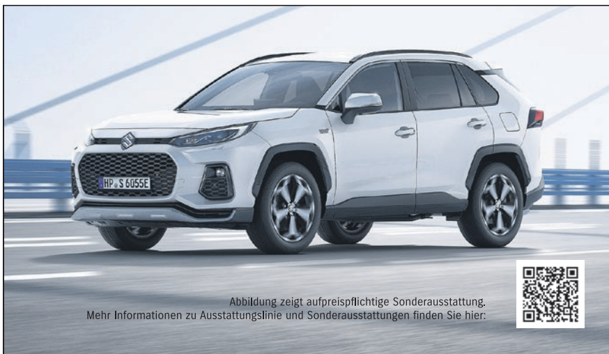
Abbildung zeigt aufpreispflichtige Sonderausstattung. Mehr Informationen zu Ausstattungslinie und Sonderausstattungen finden Sie hier: