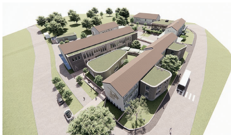
Grundschule: Architekturbüro Knapp Kubitzka

Mit durchdachter Planung, einem modernen pädagogischen Raumkonzept und dem Fokus auf Nachhaltigkeit schaffen wir langfristig op-