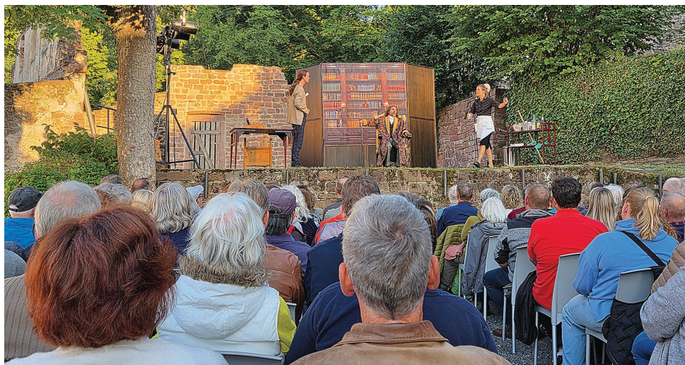
Theatertage Miltenberg

Cyrano de Bergerac ist nach Hamlet der wohl ikonischste Held der Theatergeschichte und zum 30-jährigen Jubiläum der Theatertage auf der Mildenburg findet er wieder den Weg auf die Freilichtbühne. 30 Jahre ist es her, als das damals blutjunge Team der