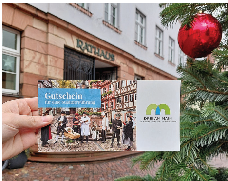
DREI AM MAIN

Alle Informationen finden Sie unter: www.miltenberg.info