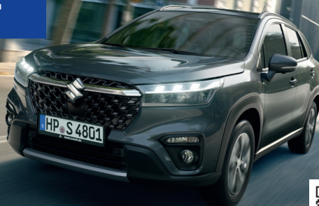
Abbildung zeigt aufpreispflichtige Sonderausstattung. Mehr Informationen zu Ausstattungslinie und Sonderausstattungen finden Sie hier: