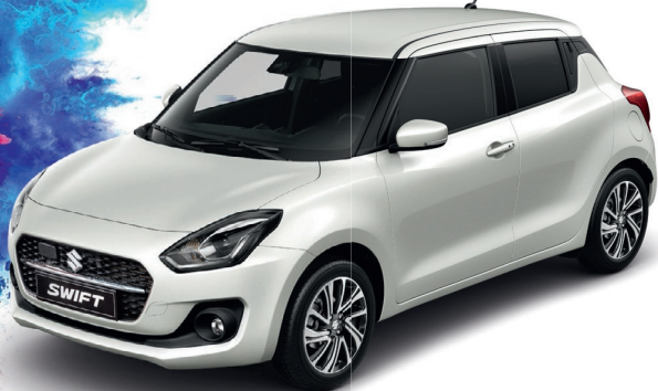
Abbildung zeigt aufpreispflichtige Sonderausstattung.

Suzuki Swift 1.2 DUALJET HYBRID Comfort (61 kW | 82 PS | 5-Gang-Schaltgetriebe | Hubraum 1.197 ccm | Kraftstoffart Benzin)