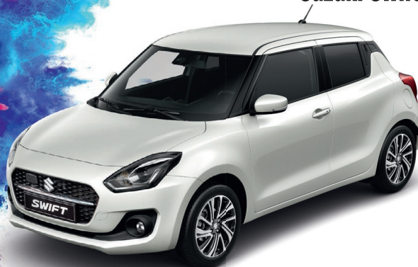
Abbildung zeigt aufpreispflichtige Sonderausstattung.

Suzuki Swift 1.2 DUALJET HYBRID Comfort (61 kW | 82 PS | 5-Gang-Schaltgetriebe | Hubraum 1.197 ccm | Kraftstoffart Benzin)