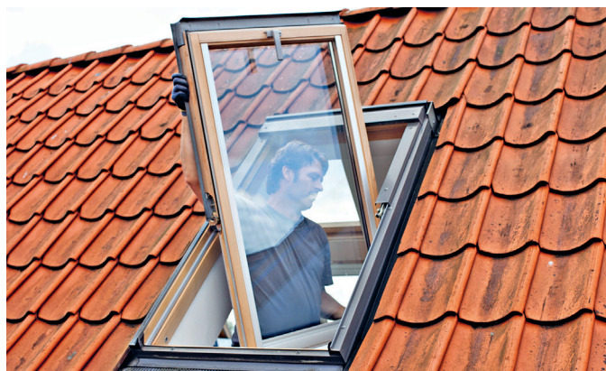
Ein Austausch alter Dachfenster gegen neue Modelle mit guten Wärmedämmwerten hilft, steigende Energiekosten zu kompensieren.

Wer unsicher ist, welche Lösung sich im eigenen Haus realisieren lässt, findet unter www.velux.de weitere Informationen und kann dort eine Tageslichtberatung inklusive Besuch vor Ort beauftragen.