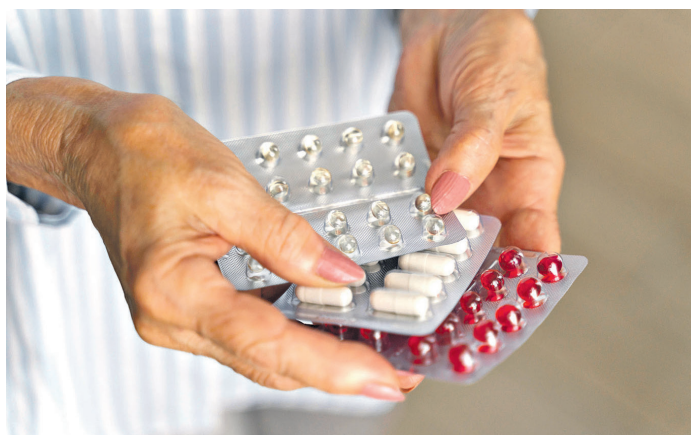
Besonders ältere Menschen, die regelmäßig Medikamente einnehmen müssen, haben Probleme mit dem neuen E-Rezept.

Die Nutzung des E-Rezepts darf aber für niemanden zur Belastung werden. Technische Probleme beim Abrufen des E-Rezepts müssen die Betreiber schnellstmöglich beheben. Sie dürfen nicht dazu führen, dass Patientinnen und Patienten länger auf ihre Arzneimittel warten müssen. Wir als Sozialverband ermahnen außerdem Praxen und Apotheken, alle Wege der Rezeptausstellung und -einlösung anzubieten: elektronisch auf der Gesundheitskarte, in der App und als Ausdruck. Gerade im Gesundheitssystem müssen bei Neuerungen alle Menschen mitgenommen werden. Wir erwarten daher bei allen Digitalisierungsschritten, die jetzt und in Zukunft anstehen, dass Barrierefreiheit mitgedacht wird – so zum Beispiel auch bei der elektronischen Patientenakte, die 2025 kommen soll.“ (Quelle: VdK)