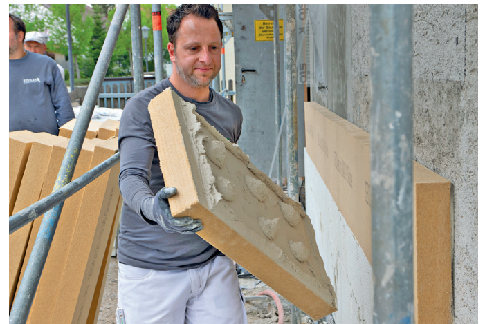
Alte Wände? Natürlich sanieren. Holzfaser-Wärmedämmverbundsysteme für gute Dämmwerte und wirkungsvollen Klimaschutz.

„Lassen Sie sich am besten von einem fachkundigen Handwerksbetrieb oder erfahrenen Energieberater beraten, der auch über erforderliche Effizienzwerte für staatliche und regionale Förderprogramme informieren kann.“