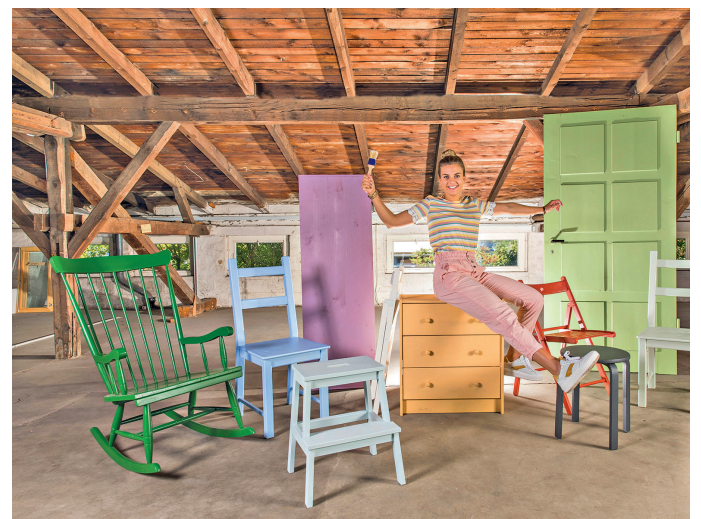
Umweltfreundliche Lacke tragen zu einem gesunden Wohnraumklima bei und punkten mit authentischen Farbtönen.

Für mehr Transparenz sorgt die volle Deklaration der eingesetzten Inhaltsstoffe auf dem Produktetikett und auf www.auro.de .