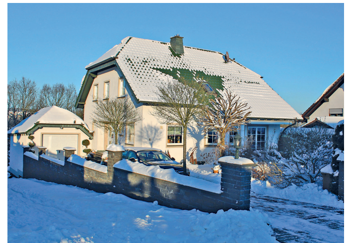
Dächer werden durch vielfältige Witterungen und Temperaturunterschiede beansprucht. Ein regelmäßiger Check sorgt für Sicherheit.

Der Zentralverband des Deutschen Dachdeckerhandwerks (ZVDH) rät daher allen Hausbesit-