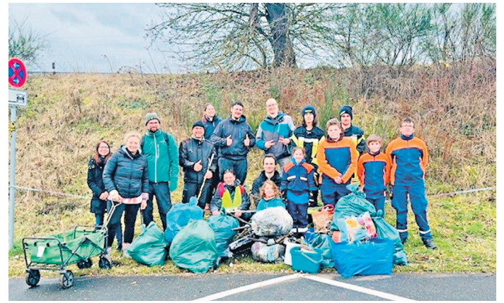
Die fleißigen Helfer konnten 216 Kilo Müll aus der Umwelt entfernen.

Am Ende standen nach unserer 2-stündigen Aktion 216 kg Müll zur Abholung bereit. Den Großteil des Gewichts machten die vielen Glasflaschen aus. Diese haben wir zum