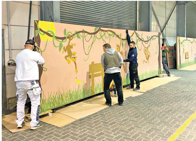
Gemeinsam gelingt der Motivwagenbau: Aktive der „Freakyfriends“ und „Fantastic Seven“ mit den bemalten Wagenteilen.

Jetzt erreicht die Faschingskampagne 2024 ihre Höhepunkte. Los geht's mit dem morgigen schmutzigen Donnerstag, dem Altweiberfasching. Am kommenden Sonntag beim Kreisfaschingsumzug in Großheubach und am Faschingsdienstag beim Kreiskarnevalszug in Niedernberg sind große und kleine Narren außer Rand und Band. Wer es bislang noch immer nicht getan hat – spätestens jetzt heißt es, die Kostüme herausholen, sich mitreißen lassen von der lebensfrohen Laune dieser tollen Tage und hinein ins Getümmel! Ob in Tanzsälen oder auf närrischen Sitzungen und vor allem auf Straßen und Gassen – jetzt wird geschunkelt, gesungen und gefeiert!