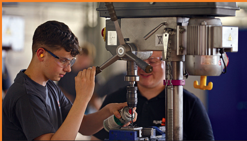
Anlagenmechaniker (m/w/d) Rohrsystemtechnik