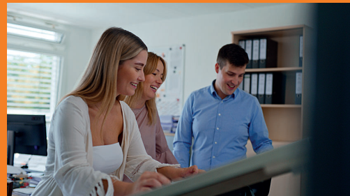
Technischer Systemplaner (m/w/d) Versorgungs- & Ausrüstungstechnik