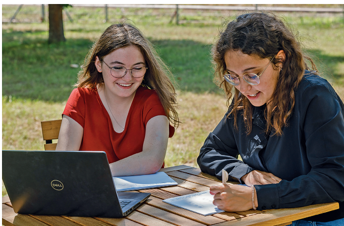
Im Outdoor Office entstehen frische Vordenker-Ideen

Beispiele für unsere Verantwortung für gesunde, fruchtbare Böden und den Klimaschutz gibt es viele: Die CO 2 -neutrale Produktion an unserem Standort in Kleinheubach, die eigens konzipierte Energieanlagen- und Gewinnung, die Elektromobilität und der Walderhalt in Tansania gehören zu den zahlreichen Bausteinen, mit denen wir unsere ambitionierte Strategie in die Wirklichkeit umsetzen.