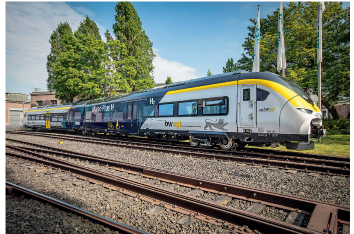
Wasserstoffbetriebene Nahverkehrszüge können ein wichtiger Bestandteil innovativer Mobilitätskonzepte sein.

Mit Wasserstoff betriebene Züge sind leise und sauber