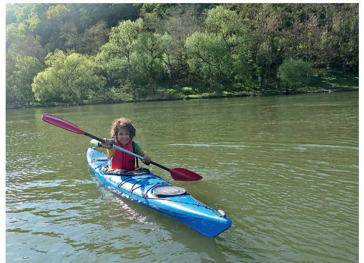
In der Jugendabteilung können die Kinder mit viel Spaß das Kanufahren lernen und dabei viele abwechslungsreiche, schöne und lustige Momente sowie Abenteuer erleben.