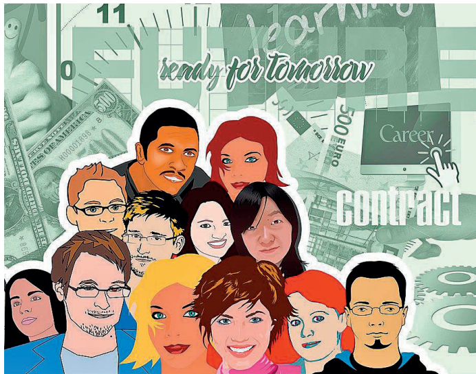
Bei einer Bewerbung ist es vor allem wichtig den Überblick zu behalten. Wir geben dir Tipps für deinen Karrierestart.

Bewerbung mit Behinderung Hast du eine Behinderung, die sich auf deine Arbeit auswirkt? Dann kannst du dies in deinem Bewerbungsschreiben erwähnen. Erkläre kurz und sachlich, welche Hilfsmittel du für den Beruf benötigst. Deine Fähigkeiten, dein Interesse und deine Motivation für den Beruf sollten jedoch im Vordergrund stehen, da dies für Ausbildungsbetriebe am wichtigsten ist.